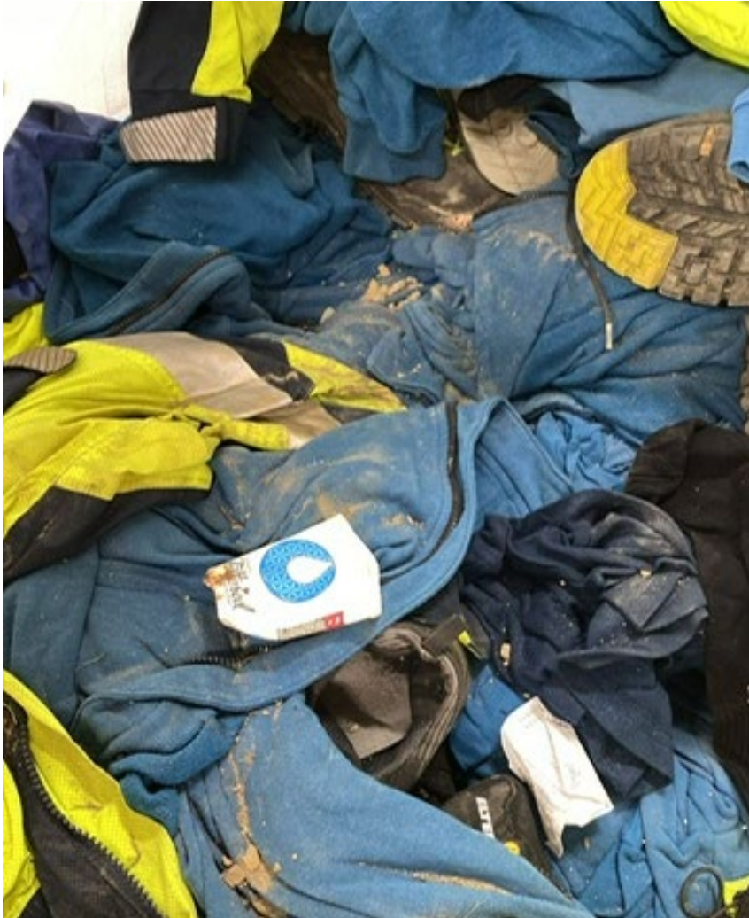
✘ Hele vieze items